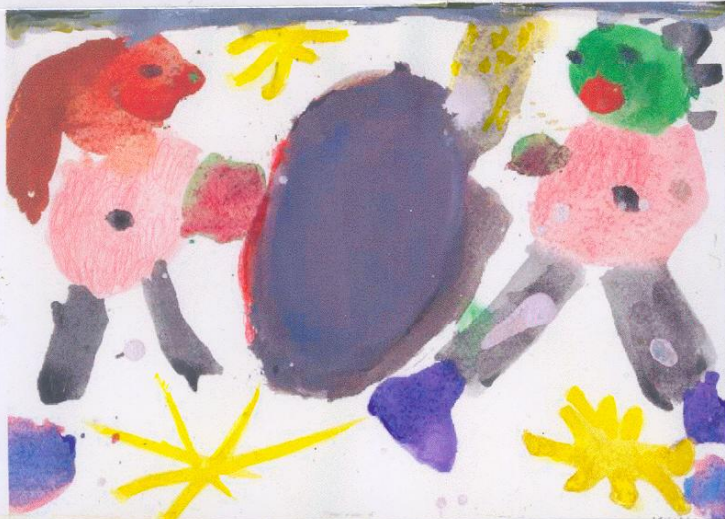
„Kanonenkugel“ („cannon-ball“) Meike N. 6,2 Jahre - Kita „Wirbelwind“, Karben